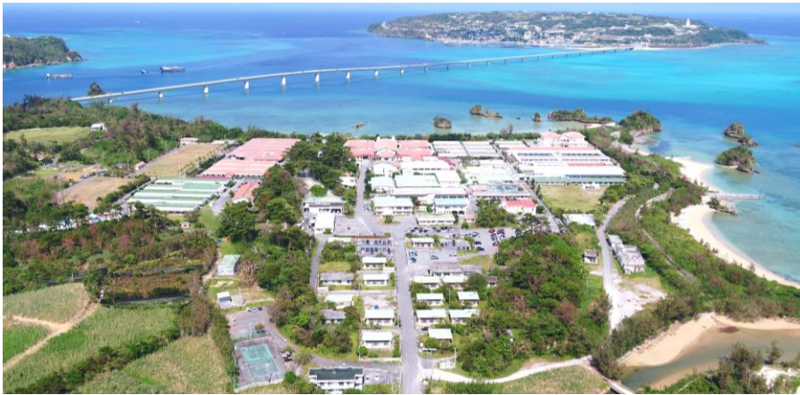
▲ 国立療養所沖縄愛楽園

沖縄愛楽園では、学芸員の方より歴史資料館内の案内と説明を受け、その後、療養所敷地内に残る建造物や史跡を巡りました。前日に平和祈念資料館も訪れていたことから、沖縄のハンセン病問題とその時代背景について、より深く理解することができました。防空壕や面会室などを見学し、当時の生活がいかに過酷であったかを実感するとともに、その時代に思いを馳せました。 沖縄ゆくな協会では、地域で暮らす回復者への医療・生活面の相談支援が積極的に行われており、回復者同士の定期交流も実施されていました。訪問時にはちょうど茶話会が開催されており、3名の方から体験談や相談支援機関への期待などを伺うことができました。沖縄で見たこと、聞いたこと、知ったこと、感じたことを、今後の「啓発活動」や「相談支援」にかاشていきたいと思ひます。