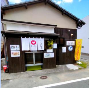
弁当店「ごはんやさん」 営業時間 11:00～14:00 ※土曜・日曜定休 熊本市東区若葉3丁目12-11