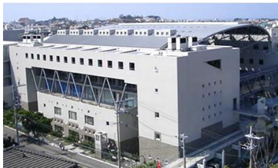
▲ 会場の沖縄県総合福祉センター

大会テーマは「制度の狭間に向き合う！生活への新たな視点（住まい・就労・つながりに寄り添う）」をテーマに社会福祉士が課題に向き合い、多領域・多職種との連携社会を目指して考えることを目的としています。また県士会設立30周年ということで、沖縄県士会功労者の表彰式もありました。