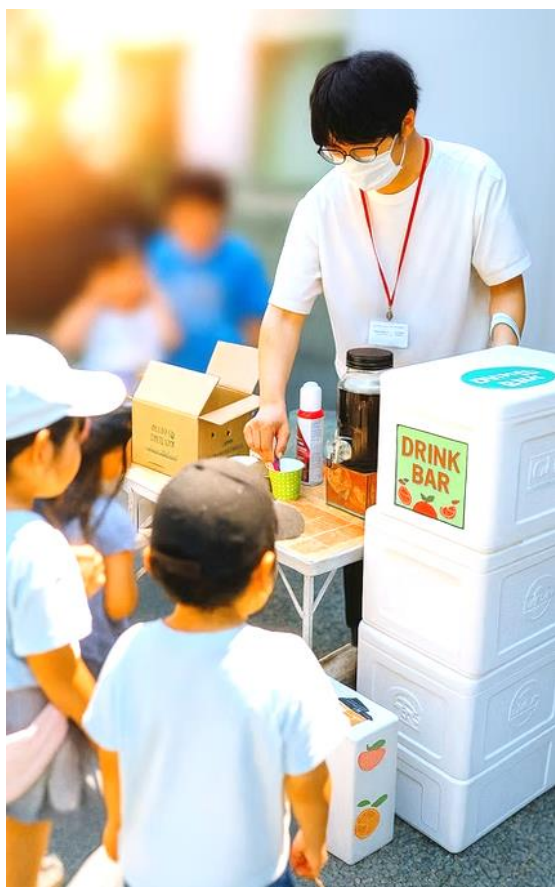
▲ こども食堂「だんらん」の様子

その後、2017年にNPO法人くまもと相談所の相談事業を立ち上げ、住まいのことや家族関係のことなどの相談を受けながら、居住支援法人として生活困窮世帯や高齢者、障がい者、子どもを養育している母子父子世帯、DV被害者等に対して、住まいの確保