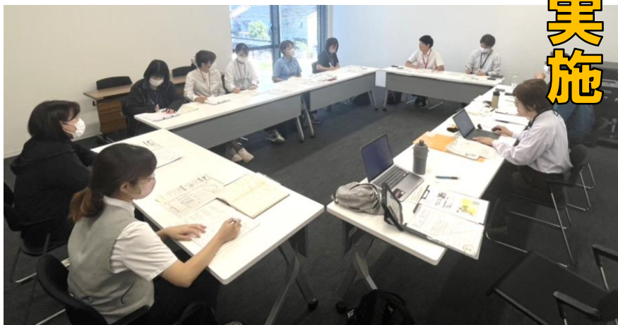
▲ 八代市 現地打ち合わせ