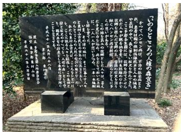
▲ 人権の森宣言の碑