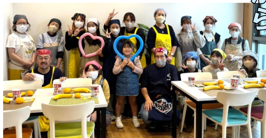
▲ 肥後銀行の店舗内で開催した「つどうごはん@合志」の様子

やその後の支援を実施され、現在では困難を抱える女性が自立した生活を送ることができるようになるためのシェアハウスも運営されています。