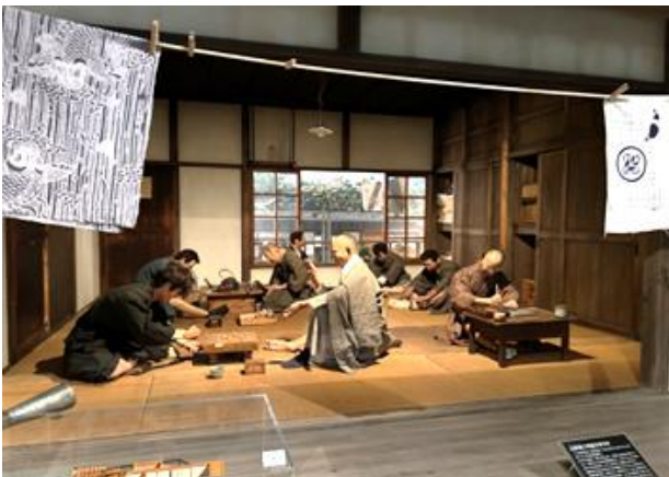
▲ 国立ハンセン病資料館多磨全生園展示

「無知が差別を生む」「知ろうとしないことが罪である」との言葉があるように、正しい知識の啓発に努めていきたいと思ひます。