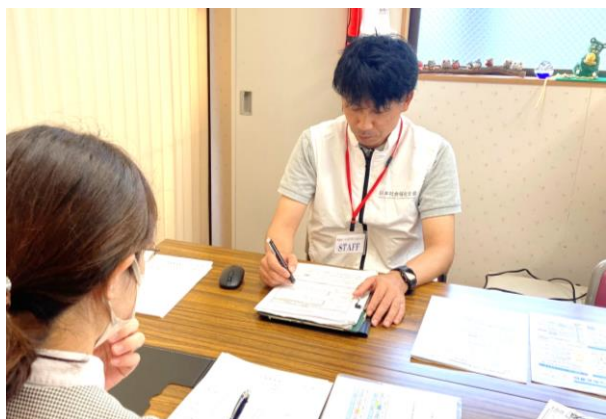
▲ 訪問後に地域包括支援センター職員と情報共有