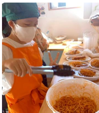
▲ 食堂の準備をする様子